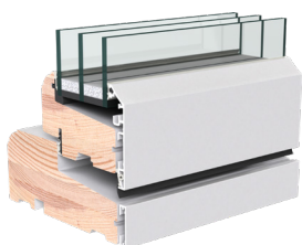
➤ VELFAC Classic karmudsnit

Serien består af vinduer og døre i en alu/trækonstruktion, der kræver minimalt vedligehold, eller i en smuk, ren trækonstruktion. 3-lags ruden med energimærke A hjælper godt til at holde på varmen. Du kan dog få en 2-lags konstruktion med energimærke B, som er godkendt til fx udhus eller sommerhus.