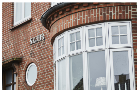
➤ Design vinduerne så de passer til husets stil

Det betyder, at du kan bibeholde bygningens klassiske udtryk, selvom vinduerne er helt nye og lever op til moderne energimærkning.