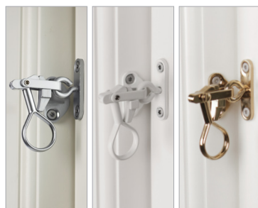
➤ Bredt udvalg af gennemtænkt tilbehør